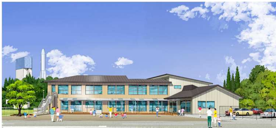
< 2階 >